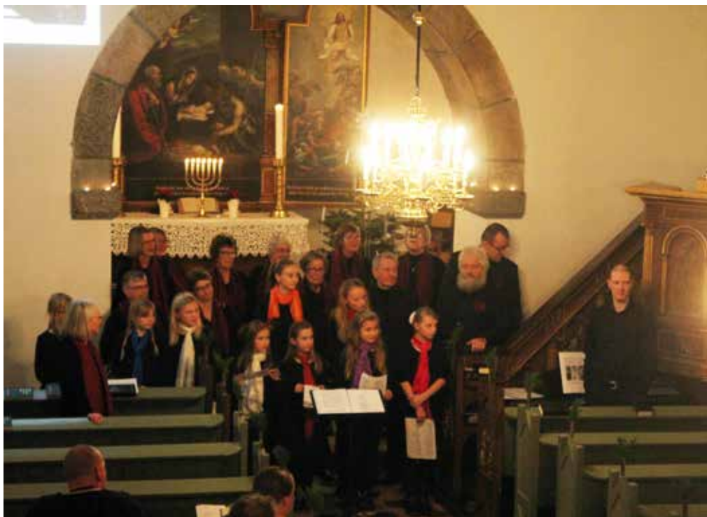
Voksenkoret og Løvsangerne ved De ni læsninger i Houbjerg i december.