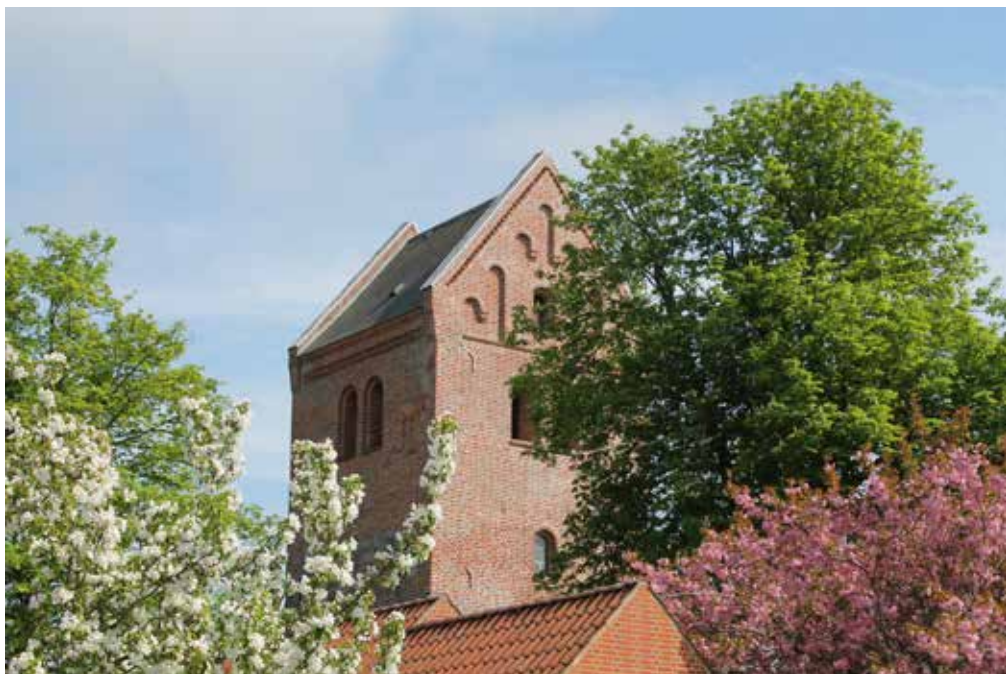
Sall kirkes tårn omgivet af forår