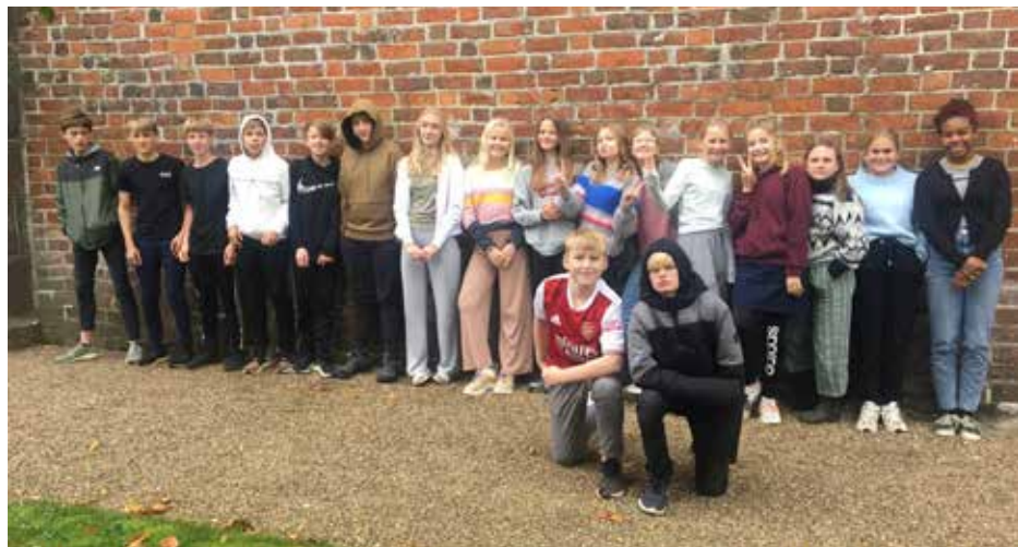
Nuværende konfirmander fra Frijsendal Friskole v. Sall kirke