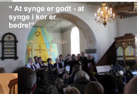
“ At synge er godt - at synge i kor er bedret!”