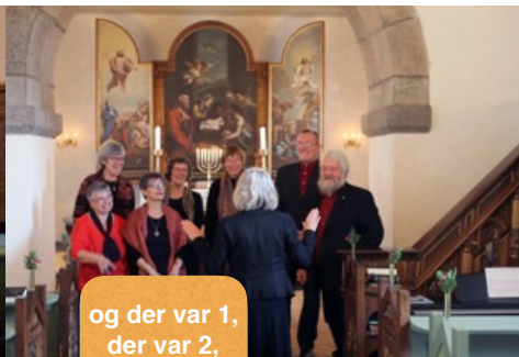
og der var 1, der var 2, der var 3 herrer