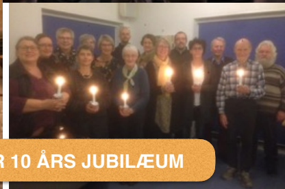
SOGNEKORET FEJRRER 10 ÅRS JUBILÆUM