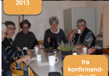
fra konfirmandstue til Sognehus. indvielse 7.maj 2017