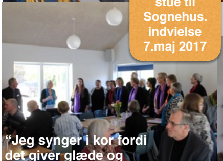
“Jeg synger i kor fordi det giver glæde og livskvalitet for mig at synge, og kor er også fællesskab”